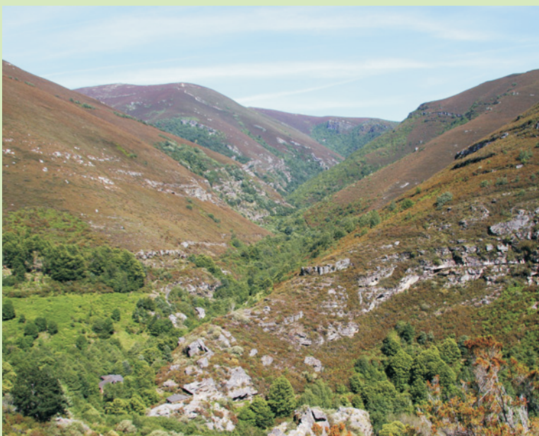
Parte baixa do val do rego de Montouto