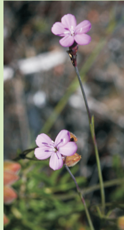
Dianthus langeanus , un pequeno caravel de montaña.