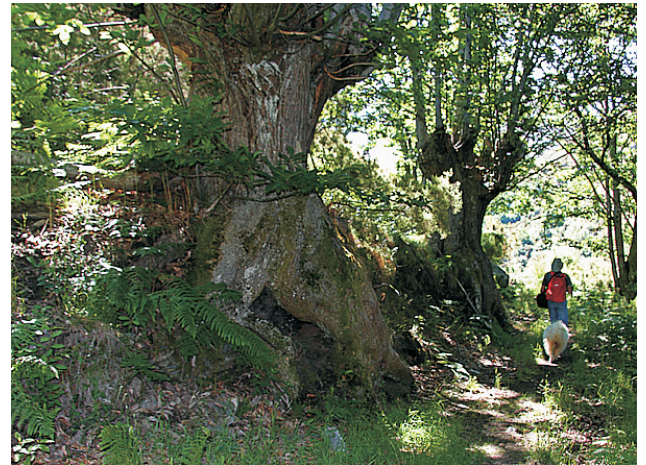
Castiñeiro no souto do Mazo