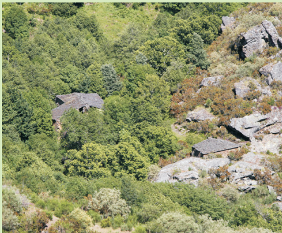
Restos do Mazo do Soldón