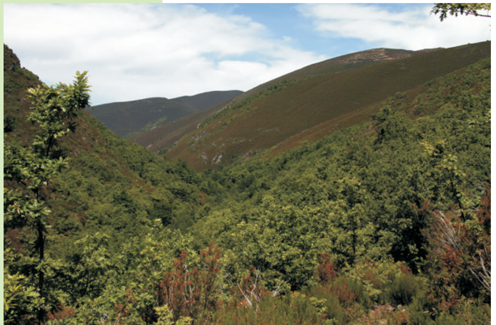
A Devesa do Cervo e o val do Montouto