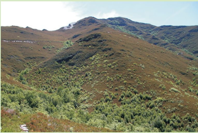
Cume do Montouto