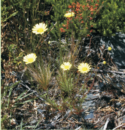
Leucanemopsis flaveola endemismo do noroeste da península ibérica