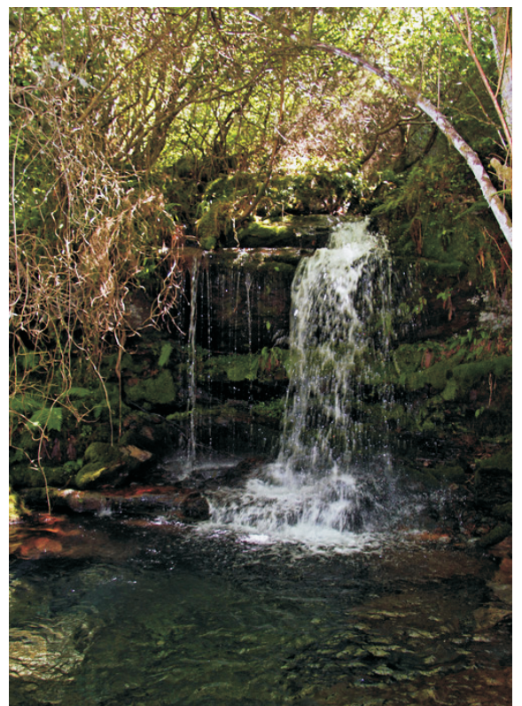
Pincheira no rego de Rinán, un afluente do Montouto.