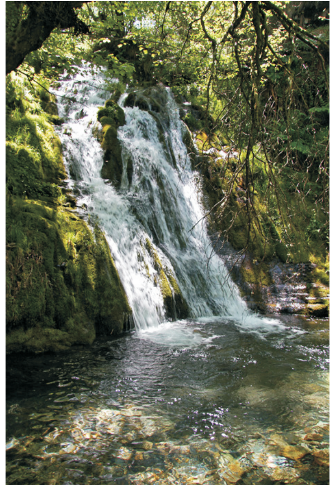
Pincheira no rego de Montouto

Desde Quiroga cóllese á estrada á Cruz de Outeiro e A Seara. Un pouco antes de chegar a Soldón atópase, a dereita da estrada, un indicador que sinala o Mazo. Baixamos pola pista de terra e deixamos o coche xunto ás casas do lugar. Para comezar a ruta cruzamos o río e seguimos cara á dereita, podendo baixar ata a ferrería, cruzar o río e remontalo ou seguir o camiño polo souto do lugar. A ruta remata nos cumes ao atoparse coa pista de terra que ven desde A Seara e remata en Arnado (León). Para subir ao cumo do Montouto habería que pasar por debaixo da canteira de Lousa e remontar polo cortalumes (uns 3 km máis de alta dificultade).