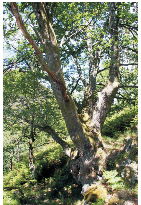
Carballo centenariano na parte alta da Devesa.